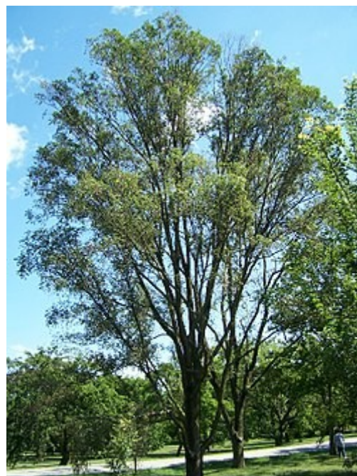
Ulmus pumila , habitus.