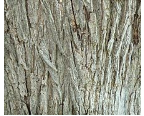
Corteza de un árbol adulto.

Además de "olmo de Siberia", es también conocido como el "olmo asiático", "olmo enano" y (erróneamente) "olmo de China", Yu shu en chino.